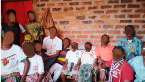
Jóvenes del centro de Bangui

La Cofradía de San Antón sigue dedicando la mayor parte de sus ingresos a obras sociales: Cáritas Parroquial, Escuela del Alto de Bolivia y construcción y ayuda a niñas de Bangui (República Centroafricana).